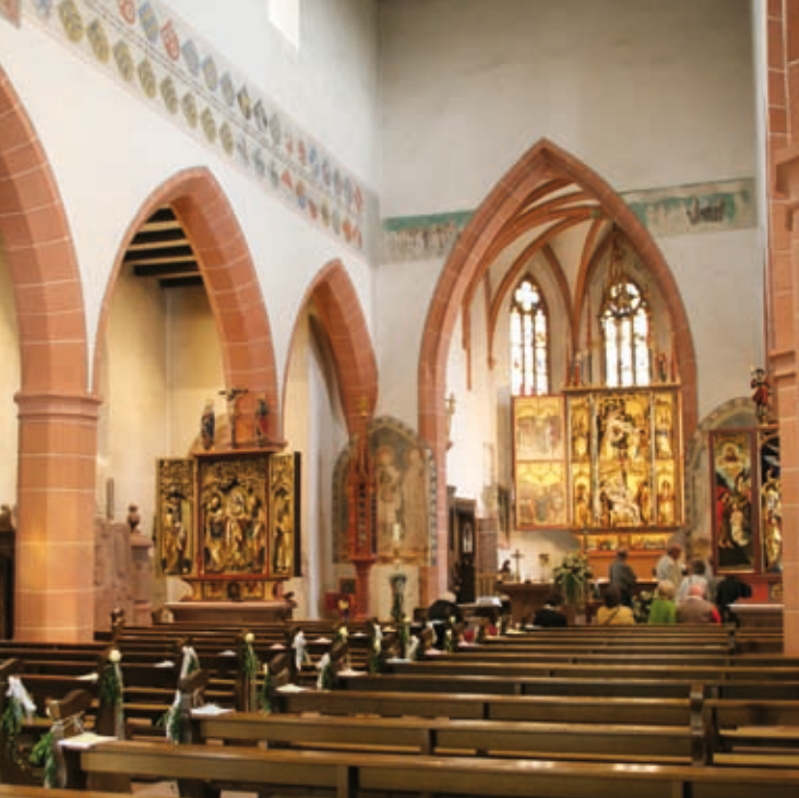
Titelbild: Ausstellungsplakat; (c) Badische Landesbibliothek Karlsruhe