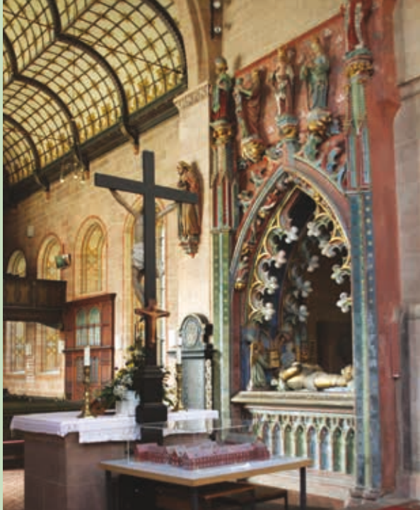
Oben: Klosterkirche Herrenalb; © Foto: Gerd Eichmann, Wikimedia Commons